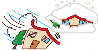
台風や大雪による被害